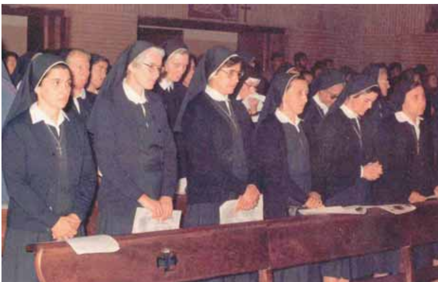
Eucaristía de las primeras Misioneras que partieron a Perú

La celebración en 2009 del 4º CENTENARIO de la fundación del Instituto, 1609–2009, va a ser también un acontecimiento muy importante que impulsará el nuevo Equipo General. ¡Han pasado CUATROCIENTOS AÑOS desde que se iniciara el gran sueño de MARY WARD! Todas las Provincias del Instituto se volcarán en los festejos. Nos llena de alegría además el que este acontecimiento se celebrará conjuntamente con la Rama Romana (ahora Congregatio Jesu).