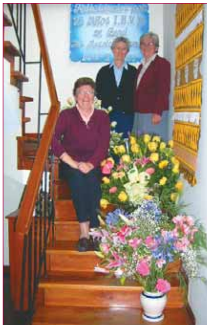
XXV Aniversario del IBVM en Perú

Si echamos la vista atrás, vemos ahora los principales acontecimientos de los últimos años: la reunificación de las dos Ramas del Instituto, que no ha sido fácil pero sí un éxito; la puesta en común de las bases para el Ministerio educativo; la apuesta de todo el IBVM por la promoción de la Justicia, Paz e Integridad de la Creación, que nos ha permitido, incluso, estar presentes en la ONU; la expansión del Instituto, como consecuencia de la iniciativa Valentía para Movernos, gracias a la cual estamos ahora presentes en Ecuador, las Seychelles, Ghana, Bangladesh, Albania, Timor Oriental, Zambia y Sudán.