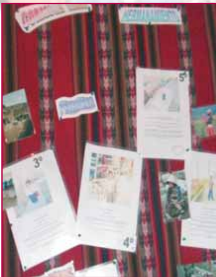
Murales con trabajos de los alumnos

Queridos amigos de Corazones Abiertos: Este curso nuestro colegio ha dado un sentido nuevo a Corazones Abiertos. Cada curso desde 3º de Primaria hasta Ciclos Formativos se ha hermanado con un/a chico/a con cuyas familias trabajan las Hermanas del IBVM en su formación humanocristiana en Perú al igual que con nosotros/as aquí en España. En concreto son doce chicos/as entre cuatro y once años de edad. Además el claustro de profesores/as y Pas ha hermanado dos niños de cuatro años y la comunidad de religiosas a una niña.