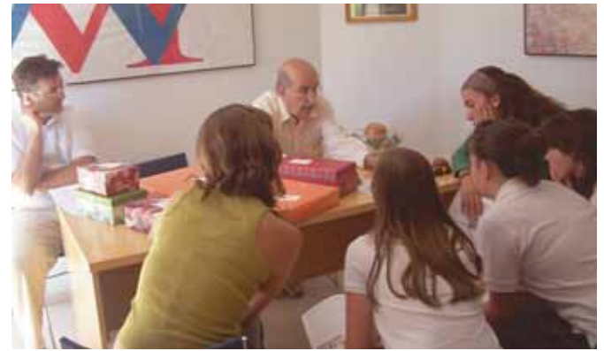
El Presidente y el Director del Colegio del Soto con las alumnas premiadas.